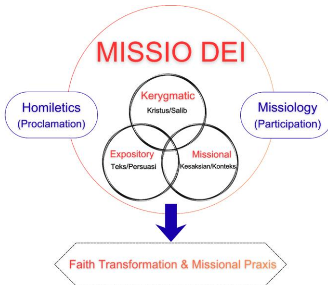
Gambar 2: Diagram Model Integrasi Konseptual

Model integratif yang diusulkan dalam penelitian ini tidak memposisikan homiletika dan misiologi sebagai dua entitas yang terpisah secara mekanis. Sebaliknya, keduanya berkonvergensi dalam kerangka Missio Dei untuk menghasilkan sebuah praksis homiletika evangelistik. Di jantung model ini terdapat tiga dimensi operasional yang saling berinteraksi: dimensi kerygmatic yang menjamin fidelitas teologis, dimensi ekspositori yang menjamin otoritas tekstual, dan dimensi misioner yang menjamin relevansi kontekstual.